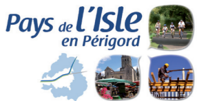
SCHÉMA DE COHÉRENCE TERRITORIALE DU PAYS DE L'ISLE EN PÉRIGORD

UN PROJET POUR L'AVENIR DU TERRITOIRE À 15 ANS