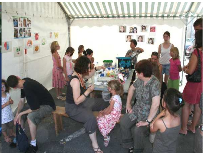
Maman a fait mouche et vient de gagner un ticket d'entrée pour le salon de maquillage